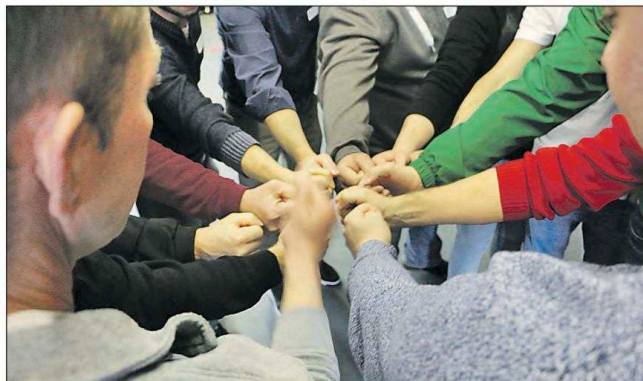
Zusammen geht besser als gegeneinander: Die in Gruppen aufgeteilten Teilnehmer liessen spielerisch die Fäuste fliegen.

Anhand von einigen Beispielen demonstrierte Hansruedi Hasler, ehemaliger Direktor des Schweizerischen Fussballverbands (SFV), wie im sportlichen