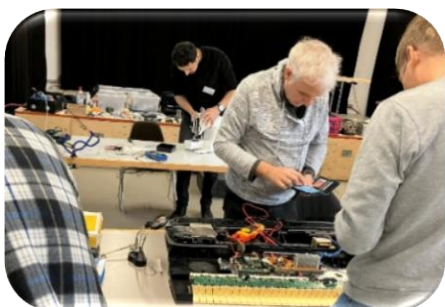
Bild: Freiwillige Reparateure im RepairCafé

Das RepairCafé wurde sechsmal im Regionalen Freizeithaus Onderwerch durchgeführt. Es zeigte sich, dass das ganze Jahr zu jeder Durchführung mehr Menschen ihre defekten Geräte zur Reparatur mitgebracht haben. Auch die Nachfrage nach weiteren RepairCafé – Anlässen war hoch, so dass im 2026 fünf RepairCafé durchgeführt werden.