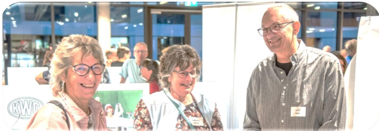
Bild: Jungsenior/-innen-Apéro Mittleres Wynental vom 21.10.2025 in der KWC, Unterkulm

Der Übergang in den Ruhestand bedeutet für viele junge Seniorinnen und Senioren neu gewonnene Freiheiten; er stellt sie aber auch vor Herausforderungen. Um in dieser Lebensphase Unterstützung zu bieten, organisierte der FB Alter am 21. Oktober für die Einwohnenden der Gemeinden Oberkulm, Unterkulm und Teufenthal erstmals einen Jungsenior/-innen-Apéro für Frischpensionierte zwischen 60 und 67 Jahren. Der Event fand in den Räumlichkeiten der KWC in Unterkulm statt und bot über 150 Jungseniorinnen und Jungsenioren die Gelegenheit, neue und alte Bekannte zu treffen und sich bei einem gemütlichen Apéro mit Gleichgesinnten über die Zeit der Pensionierung auszutauschen. Gleichzeitig boten Vereine und weitere Organisationen aus der Region im Rahmen einer Tischmesse mit gesamthaft 22 Ständen einen interessanten Einblick in das vielfältige Angebot an unterhaltsamen, sinnstiftenden und gesundheitsfördernden Aktivitäten. Der Anlass wurde im Anschluss evaluiert und stiess auf ein sehr positives Echo.