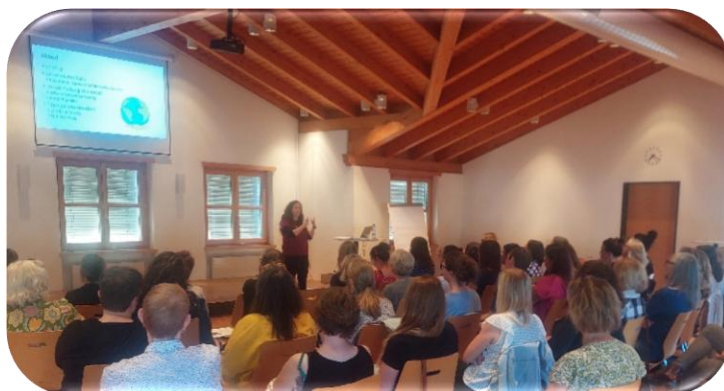
Bild: Vernetzungstreffen für die Akteurinnen und Akteure in der Frühen Kindheit vom 29.04.2025 (im Gemeindesaal Zetzwil)