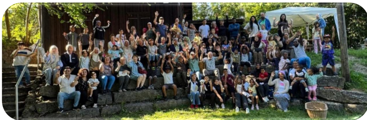
Bild: Waldfest August 2025