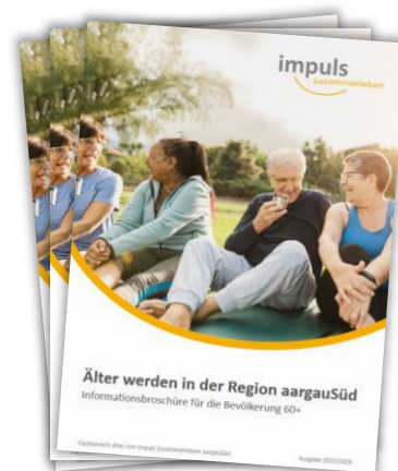
Bild: Broschüre «Älter werden in der Region aargauSüd» Ausgabe 2025/2026

Die Broschüre « Älter werden in der Region aargauSüd » ist ein praktischer Wegweiser für Menschen ab 60 Jahren und deren Angehörigen. Auf 56 Seiten bündelt sie wichtige Informationen, Anlaufstellen und Angebote rund ums Älterwerden in der Region aargauSüd. Die Broschüre wurde 2024 erstmals herausgegeben (digital und print) und an drei ausgewählte Jahrgänge der IZ-Trägergemeinden postalisch verschickt. Um die Lesefreundlichkeit zu verbessern, wurden einerseits Anpassungen am Layout der Broschüre vorgenommen. Zudem hat der Fachbereich Alter in Zusammenarbeit mit den Gemeinden und Institutionen sämtliche Inhalte auf deren Aktualität hin überprüft und revidiert; neue Angebote wurden integriert. Im Vergleich zum Vorjahr ist die Ausgabe 2025/2026 nur elektronisch als PDF-Version verfügbar und kann online unter www.impuls-zusammenleben.ch/Alter heruntergeladen werden. Um möglichst viele ältere Menschen zu erreichen, wird der Wegweiser 2026 erneut per Post und erstmals flächendeckend an die Haushalte der Senioren und Seniorinnen versendet.