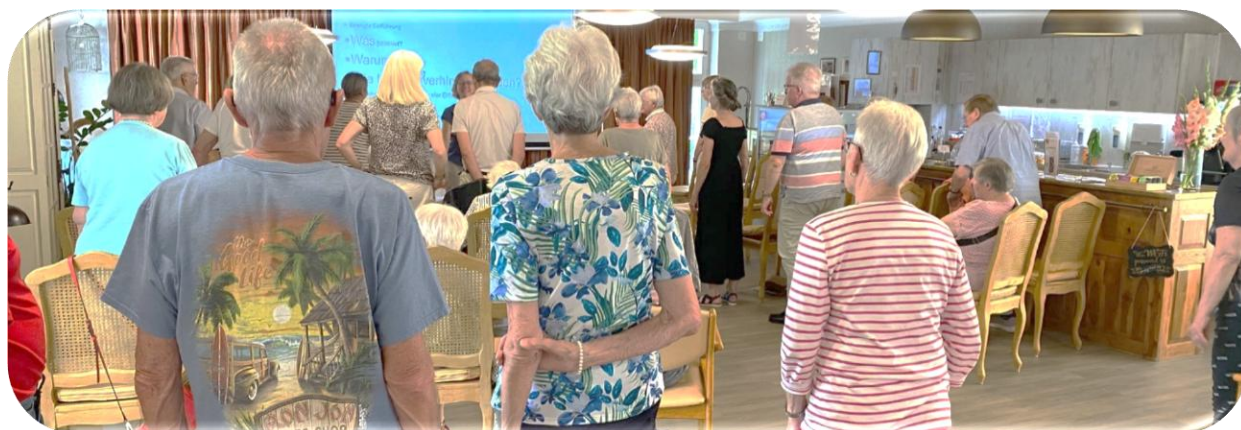
Bild: Vortrag «Sturzprävention – Alles im Gleichgewicht» vom 26.08.2025 im Pflegezentrum Sonnenberg, Reinach