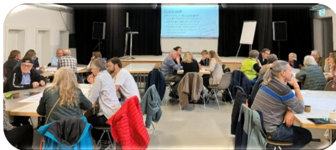
Bild: Gipfeltreffen der Vereine vom 25. 10. 2025

Das Gipfeltreffen der Vereine fand am Samstag, dem 25. Oktober, im Onderwerch statt. In diesem Jahr lag der Schwerpunkt auf der Rolle der Vereine als Begegnungsorte. Besonders erfreulich war die hohe Anzahl an Teilnehmenden, die aktiv am Austausch mitwirkten.