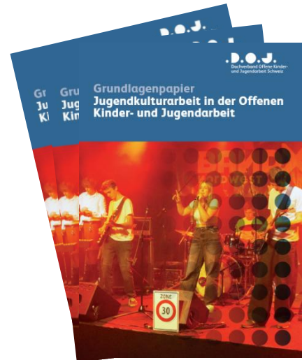
Bild: Grundlagenpapier | Jugendkulturarbeit in der offenen Kinder- und Jugendarbeit

Als Regioleitung wurde in der interkantonalen Zusammenarbeit der AGJA mitgearbeitet und zum Thema der Jugendkultur wurde auf kantonaler und nationaler Ebene an einer Fachpublikation DOJ zur Jugendkulturarbeit mitgewirkt.